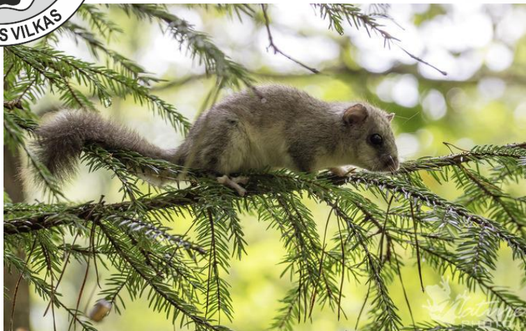
Didžioji miegapelė.