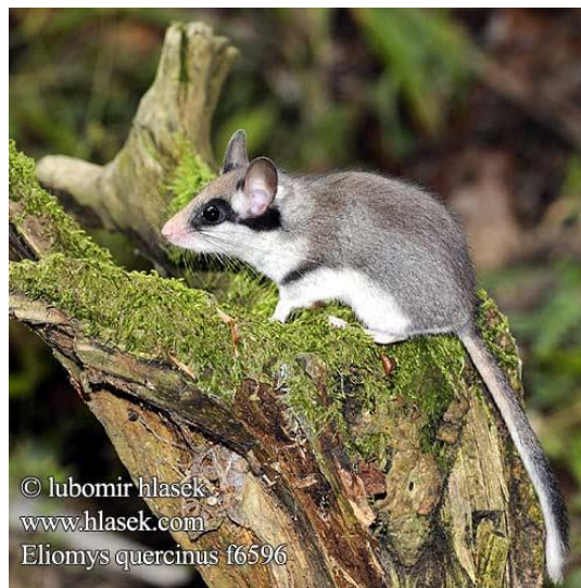
Eliomys quercinus f6596