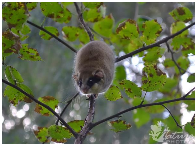
Miškinė miegapelė.