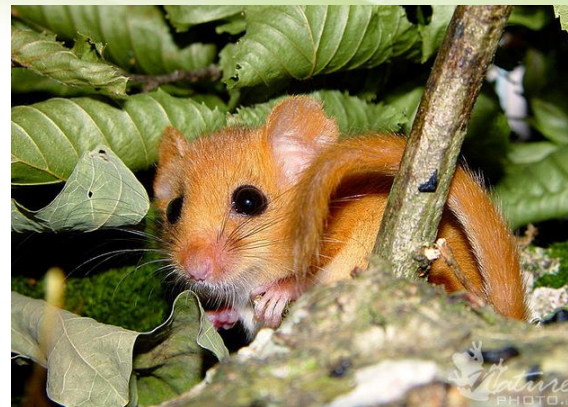
Lazdyninė miegapelė.