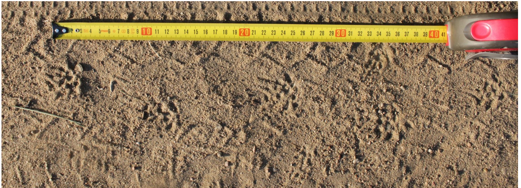
1 pav. Šeškas žingsniavo kaimo keliuku.