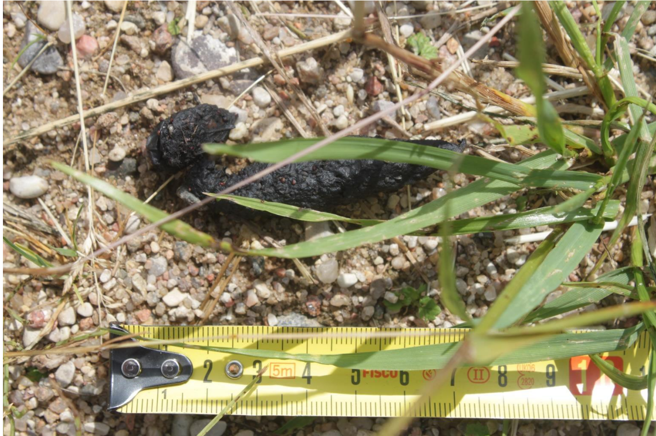
13 pav. Šeško išmatos ant keliuko, kuris eina per pievas iš vienos gyvenvietės į kitą.