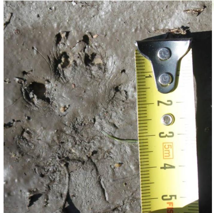
10 pav. Galinis šēško pēdsako īspaudas.