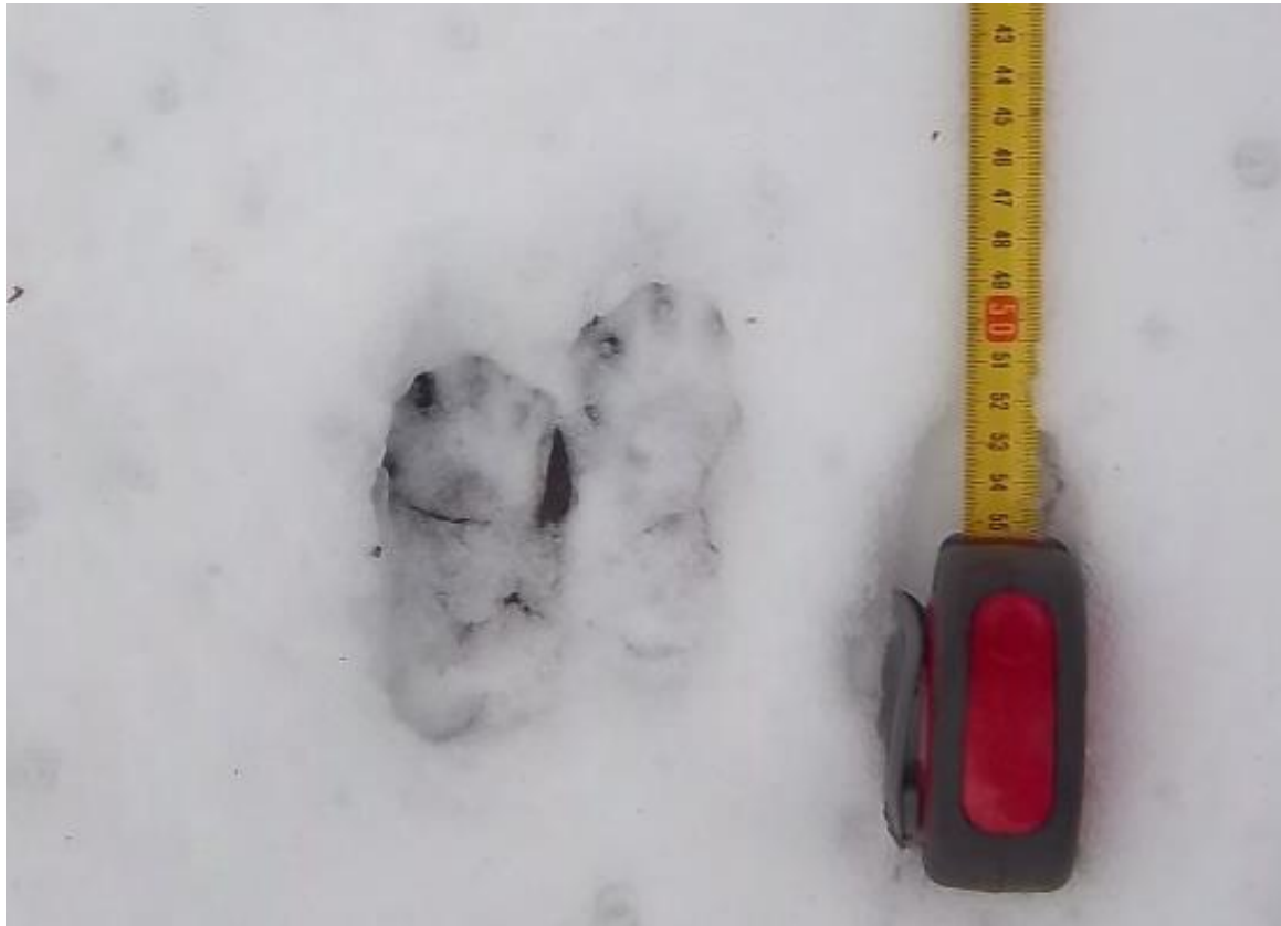
2 - 3 pav. Šeško dvejukēs sniege.