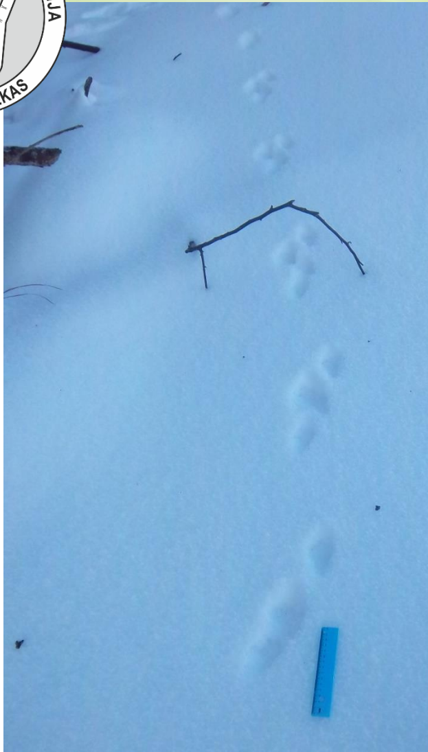
11 pav. Šeško pėdsakų eilė nėra vienoda. Pasitaiko dvejukių, trejukių, ketveriukų.