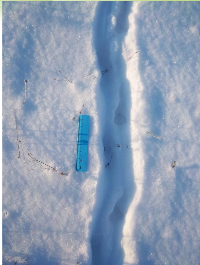
12 pav. Šeškas žingsniavo giliu sniegu. Pėdsakai vedė iš nendryno, kuriame ieškotasi maisto.