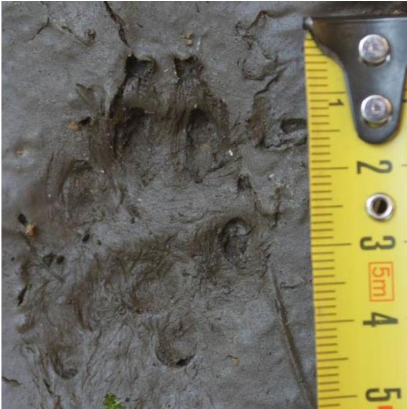
9 pav. Priekinis šēško pēdsako īspaudas.